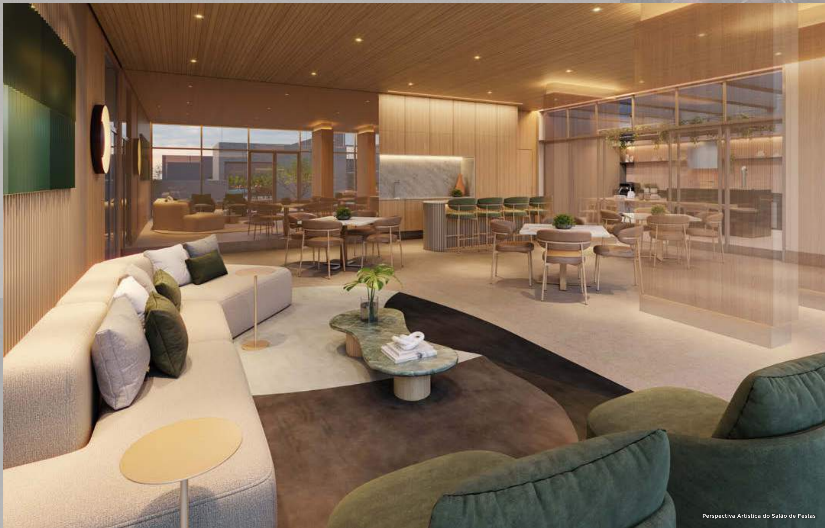
Perspectiva Artística do Salão de Festas