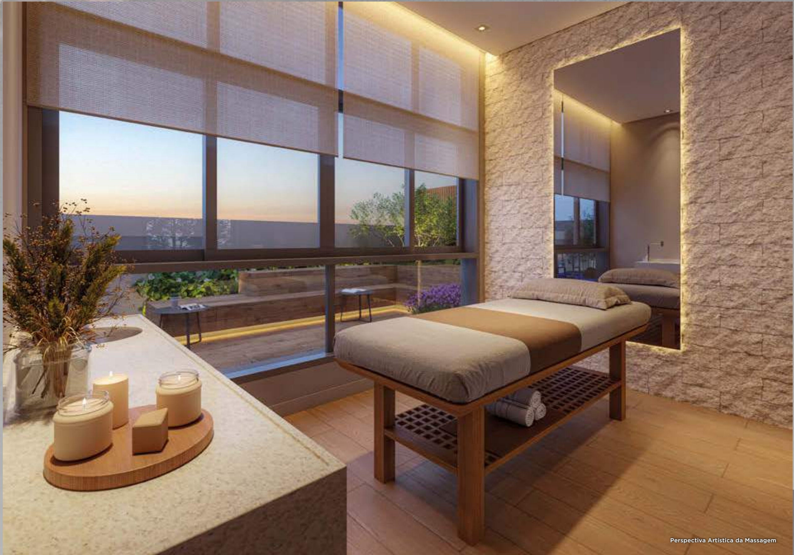
Perspectiva Artística da Massagem