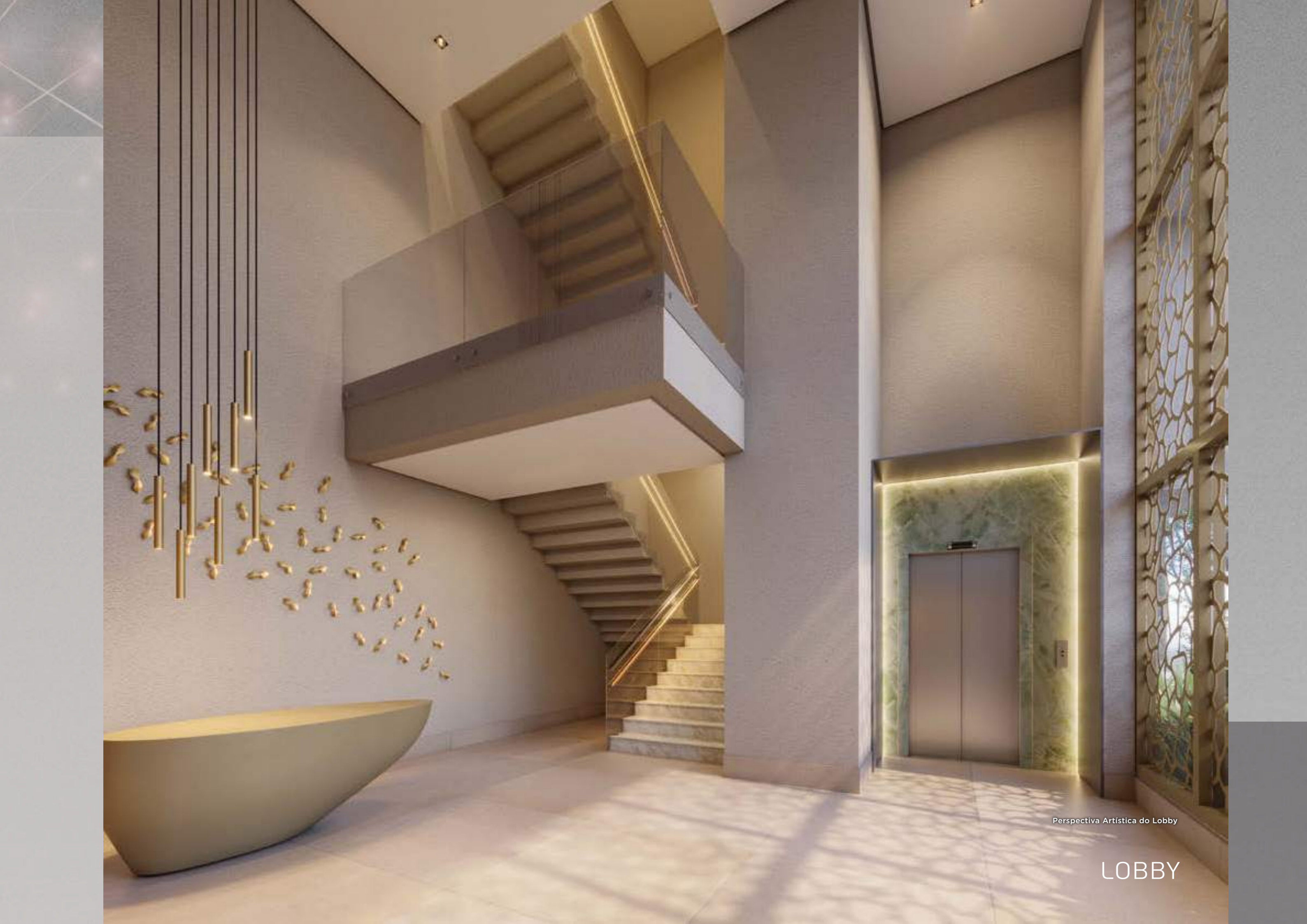
Perspectiva Artística do Lobby