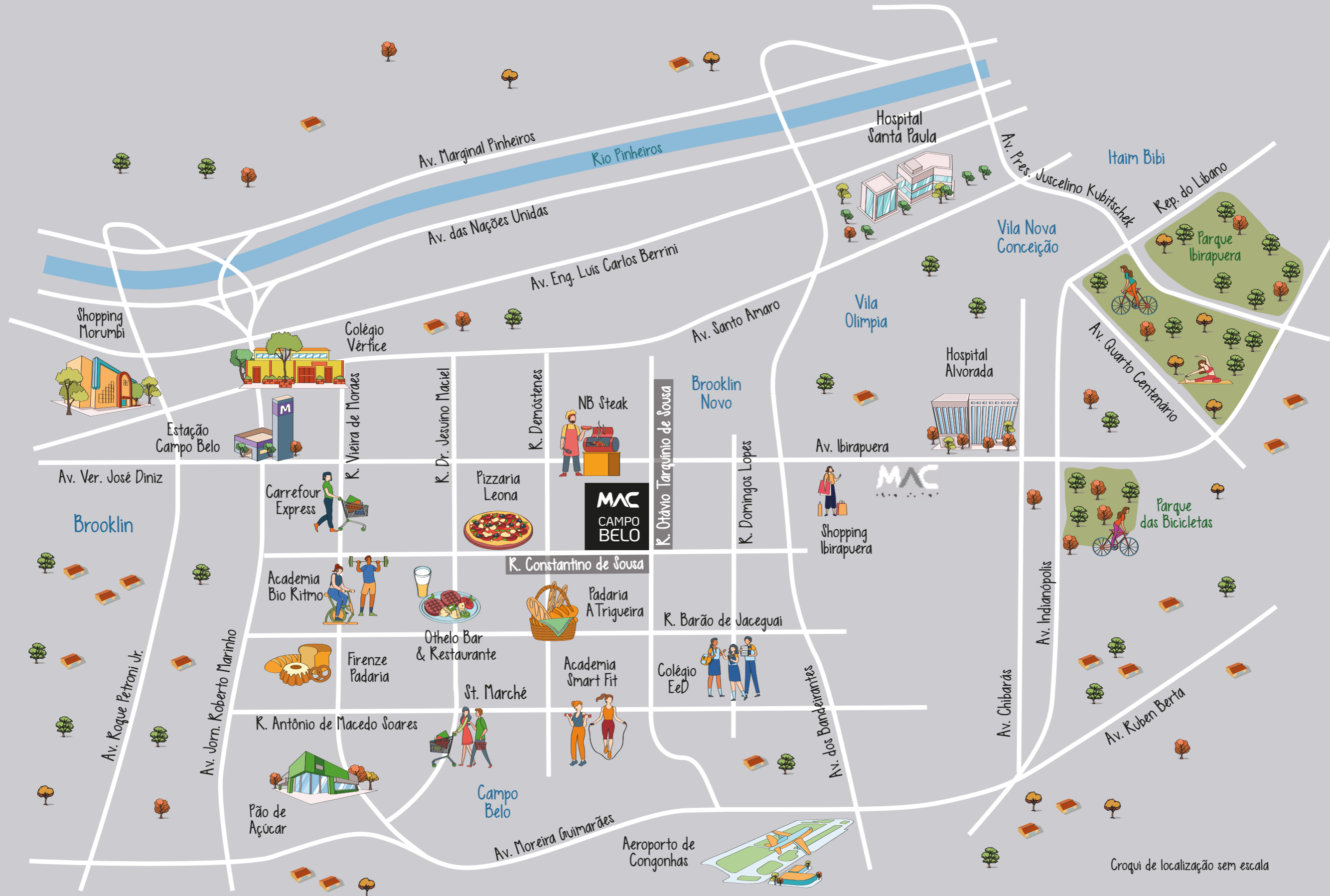
Croqui de localização sem escala