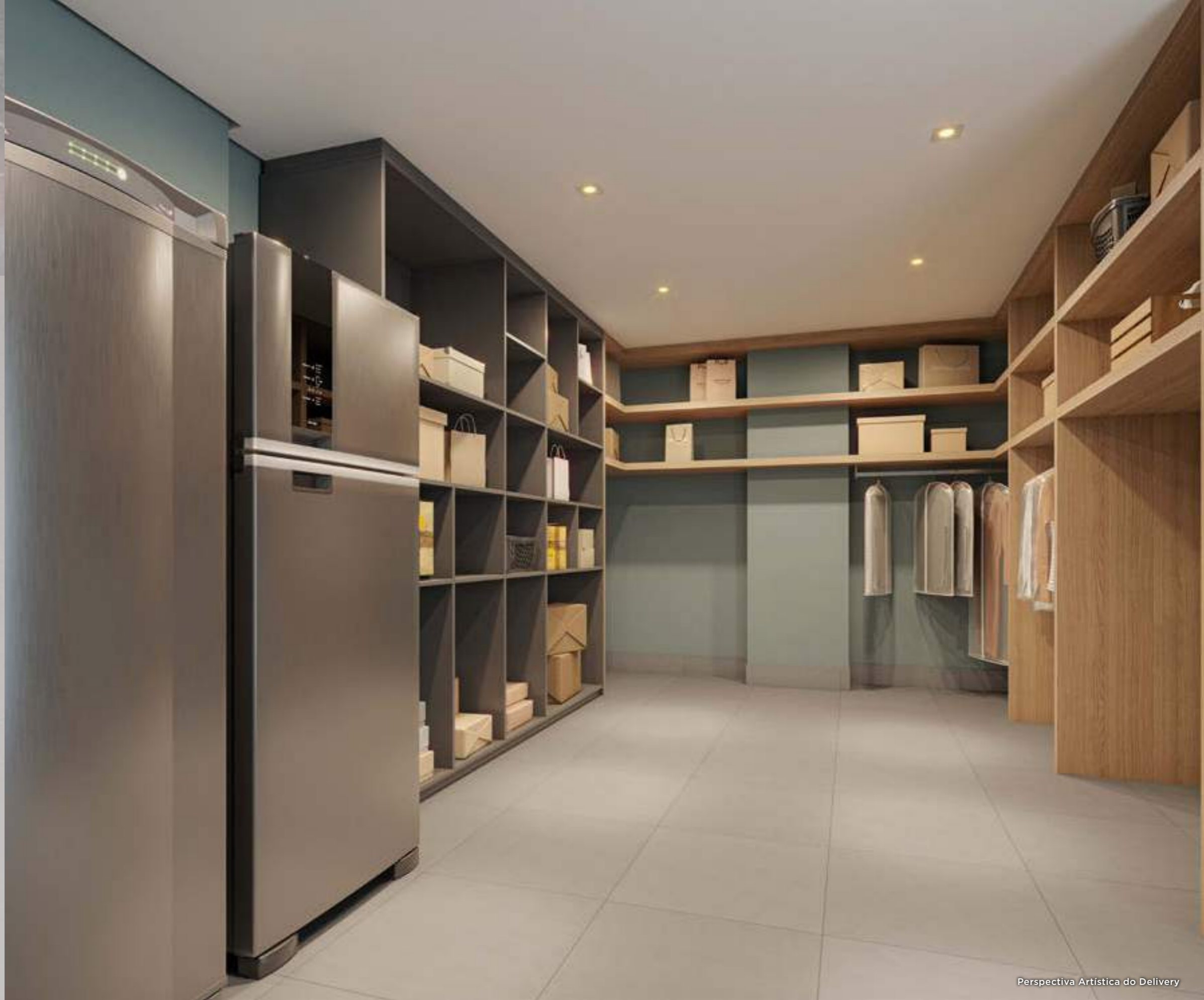
Perspectiva Artística do Delivery