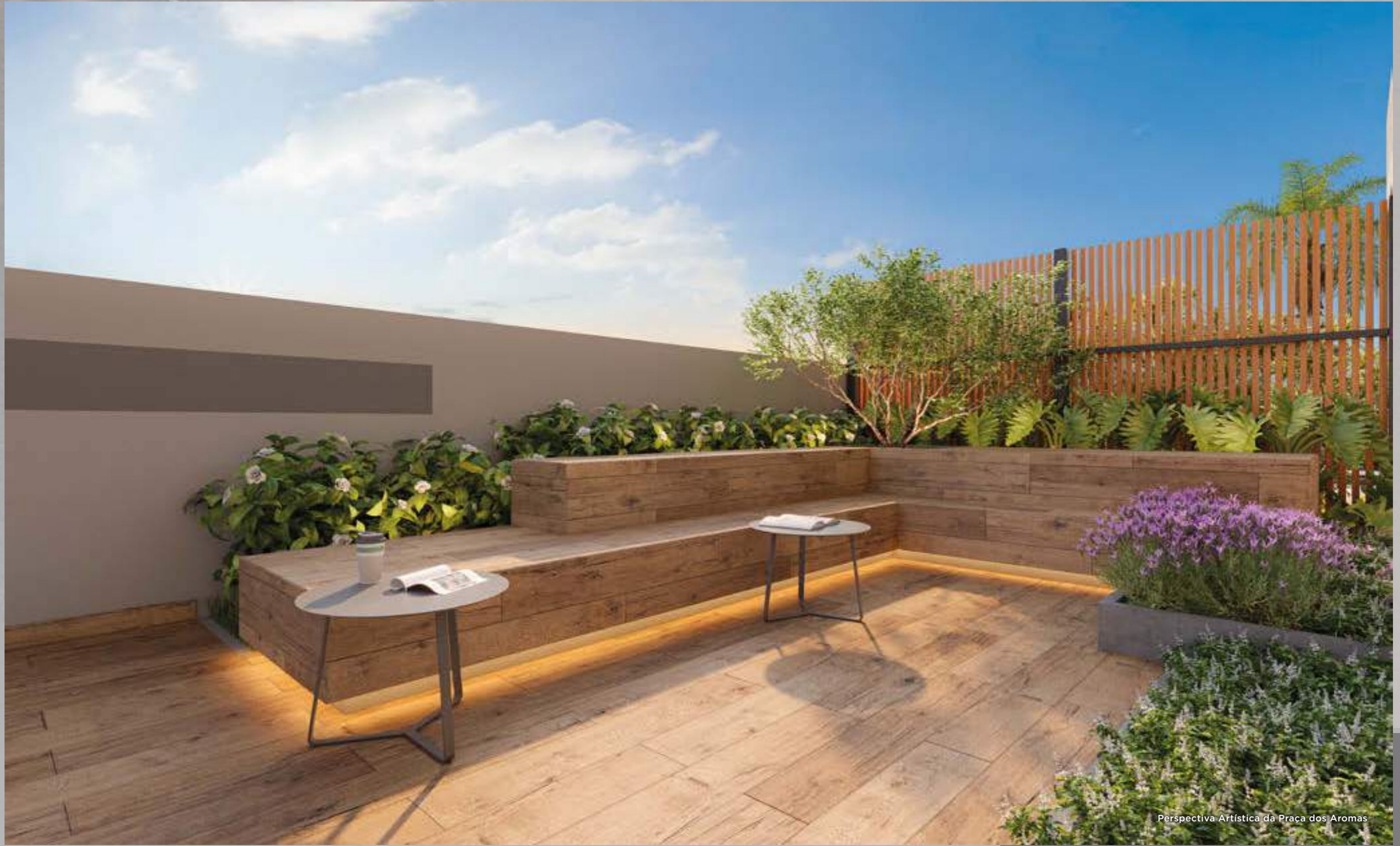
Perspectiva Artística da Praça dos Aromas