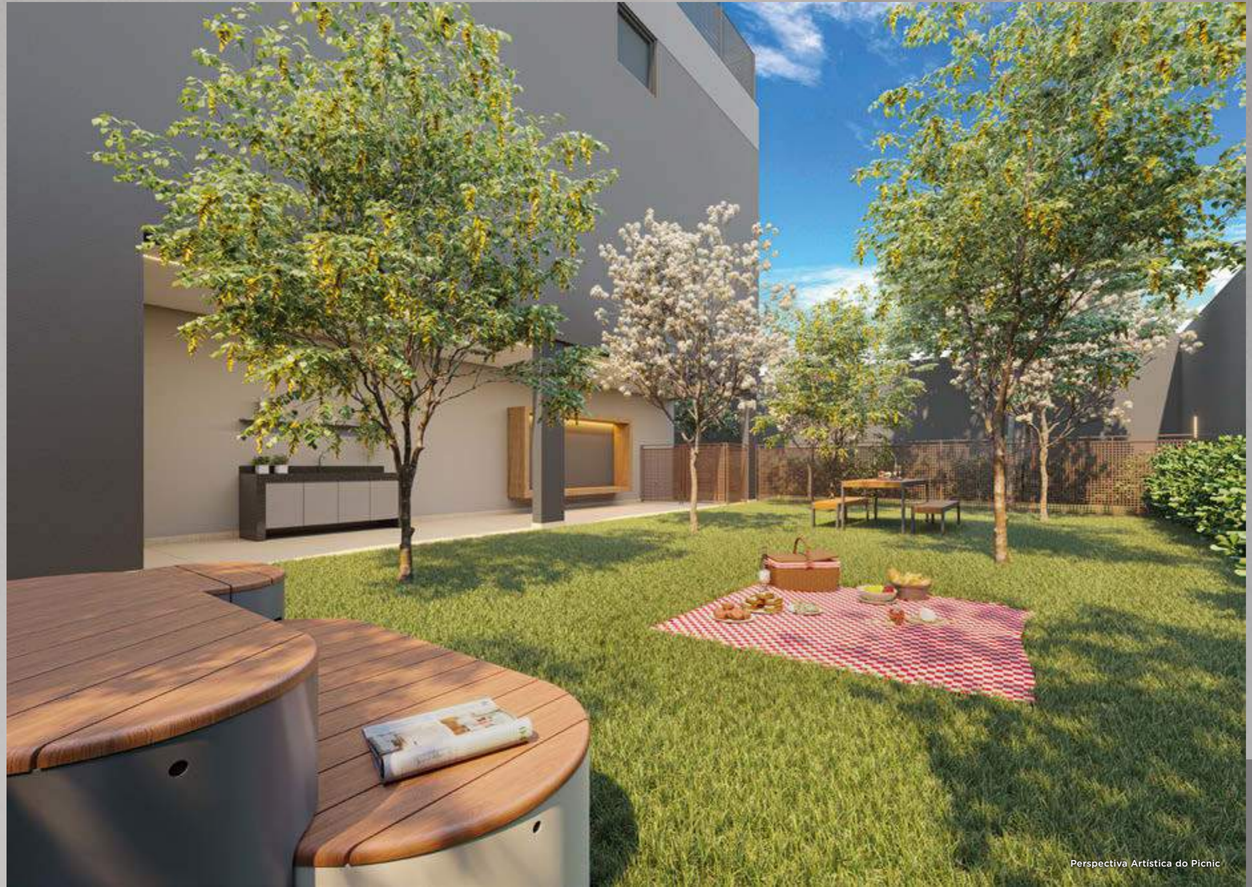
Perspectiva Artística do Picnic