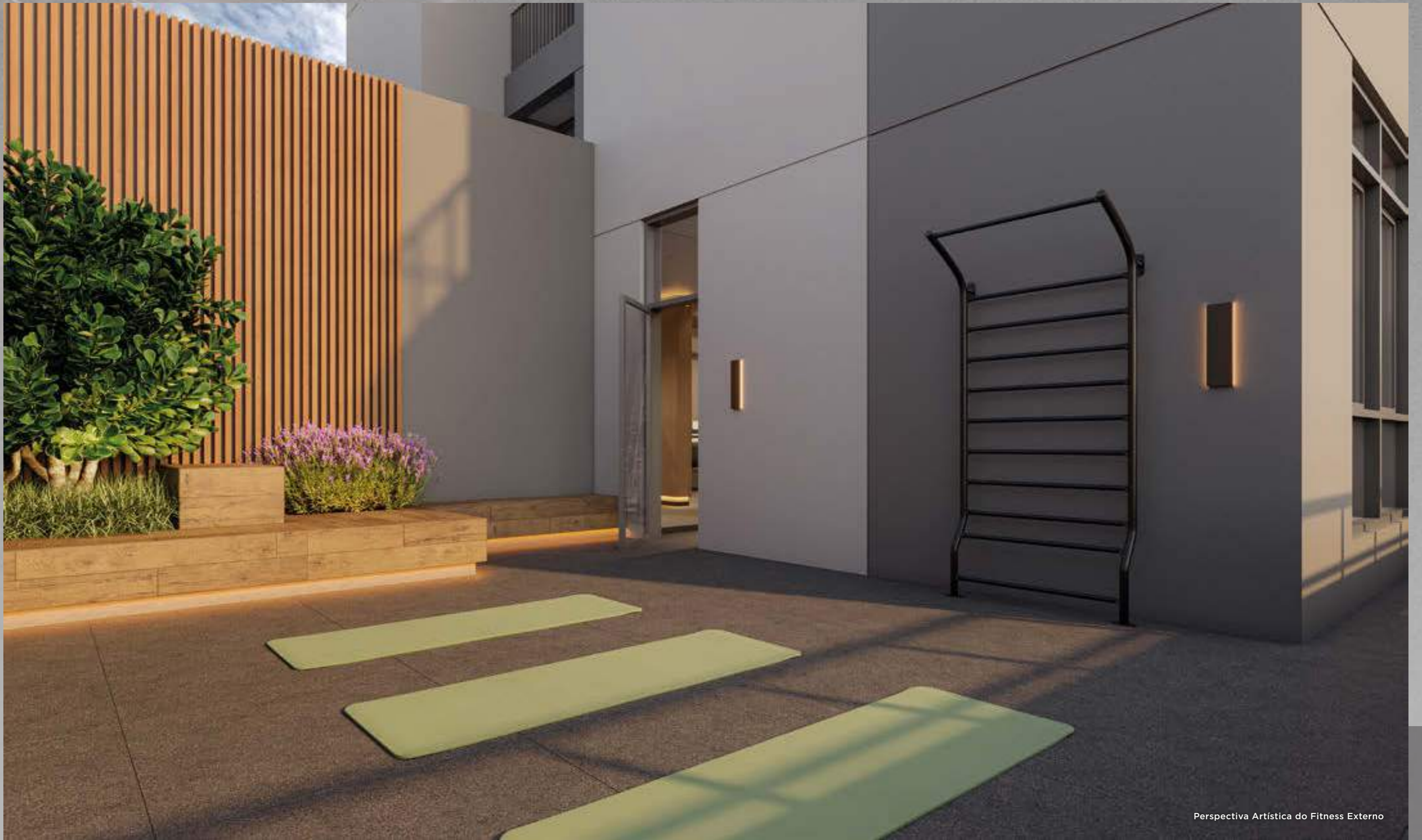
Perspectiva Artística do Fitness Externo