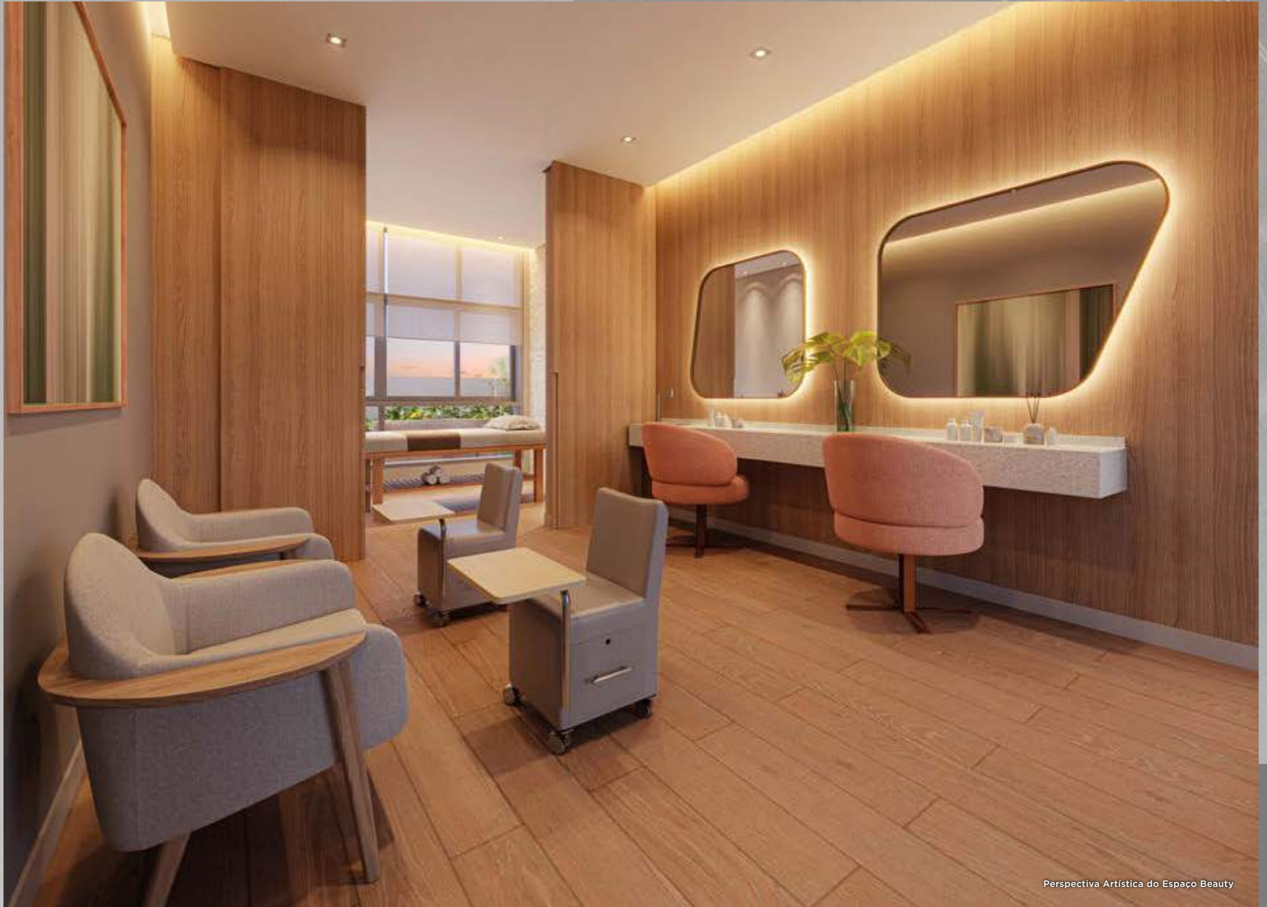
Perspectiva Artística do Espaço Beauty