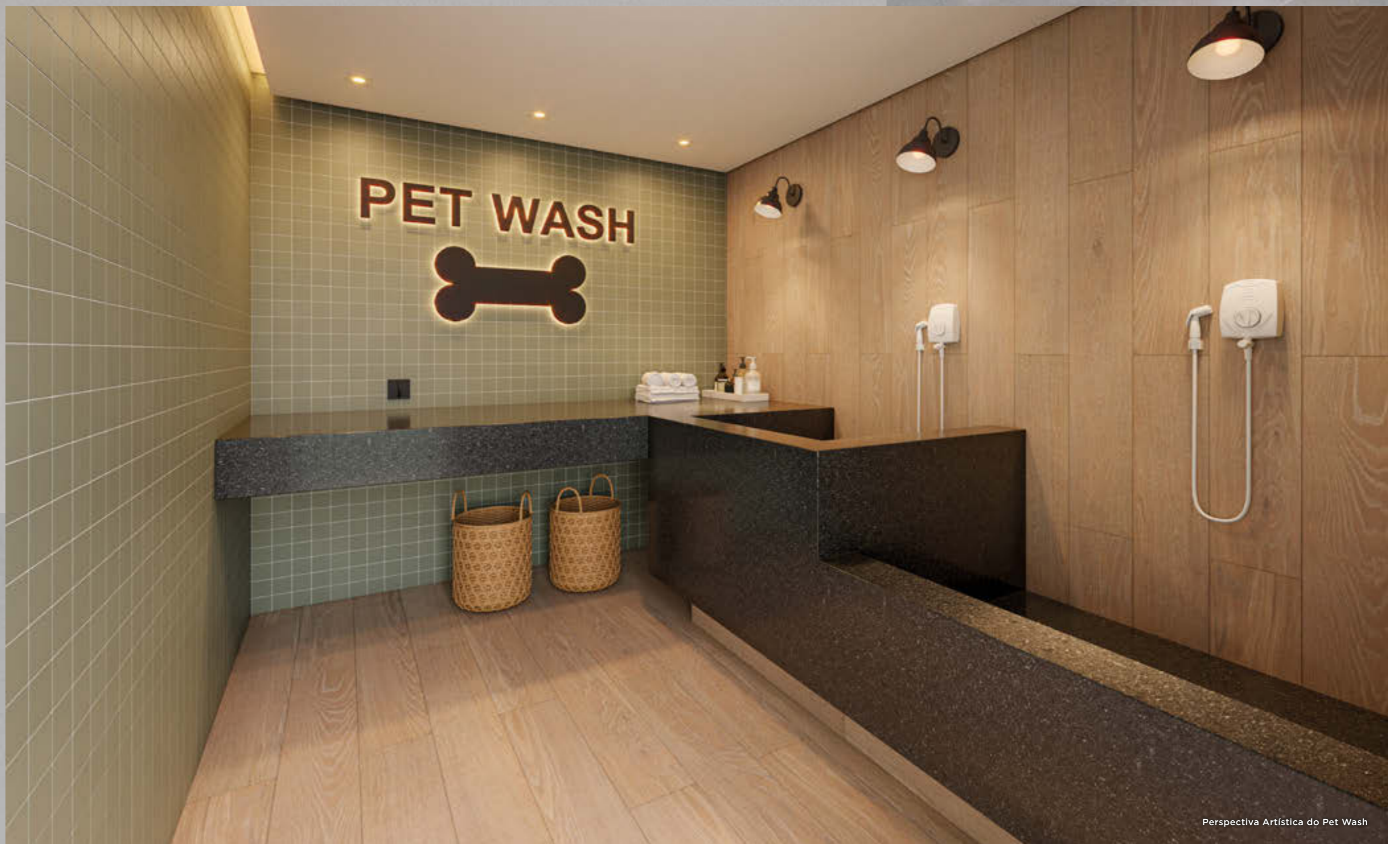
Perspectiva Artística do Pet Wash