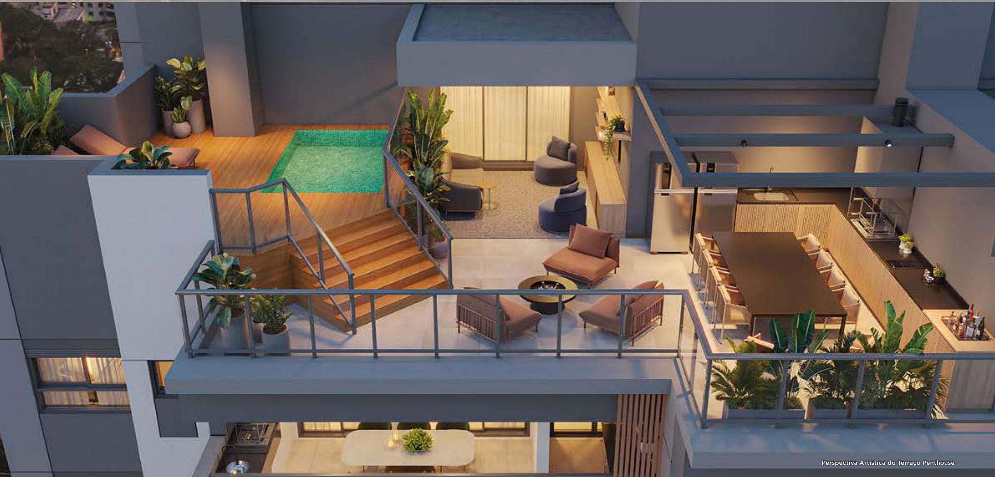
Perspectiva Artística do Terraço Penthouse