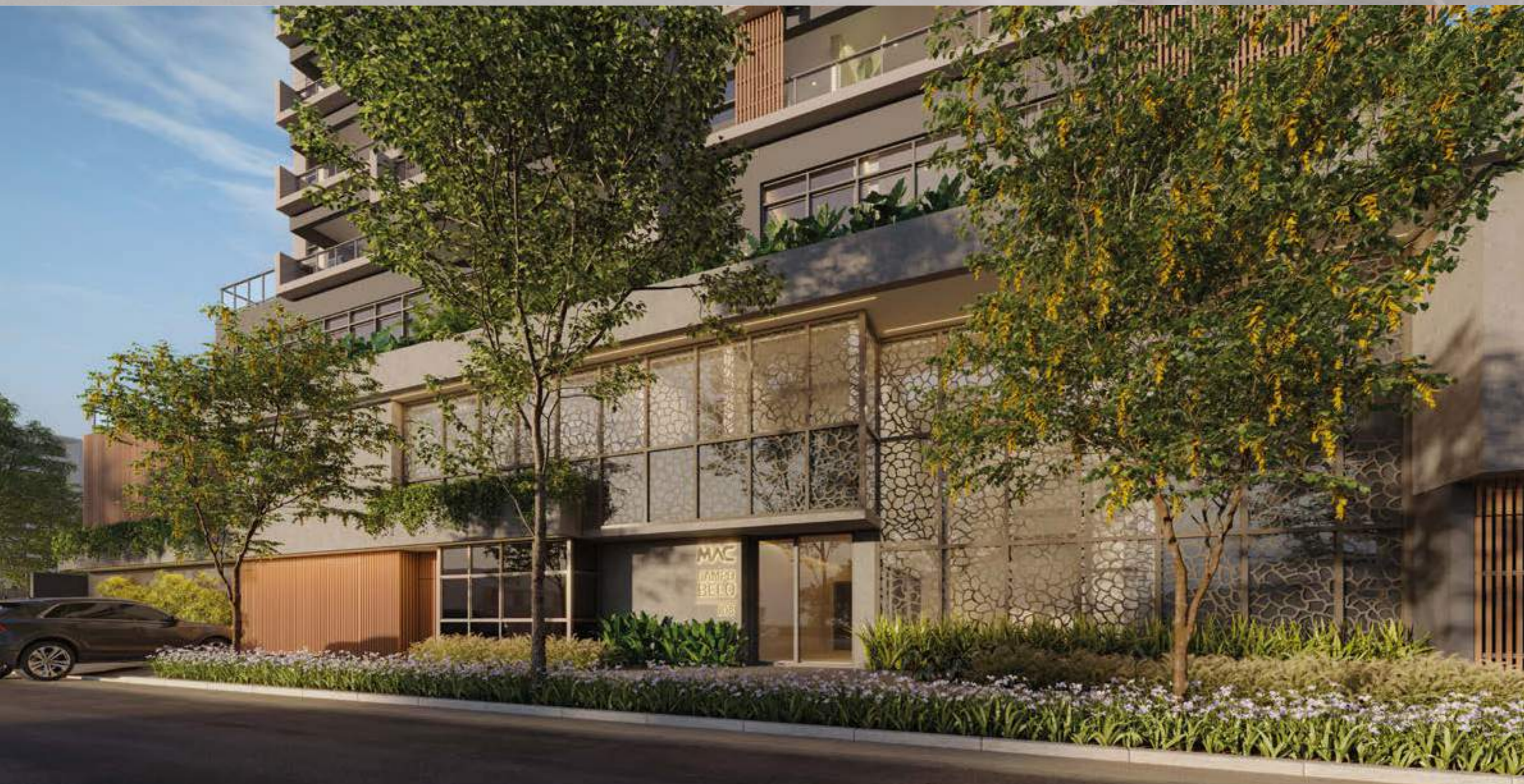
Perspectiva Artística da Portaria