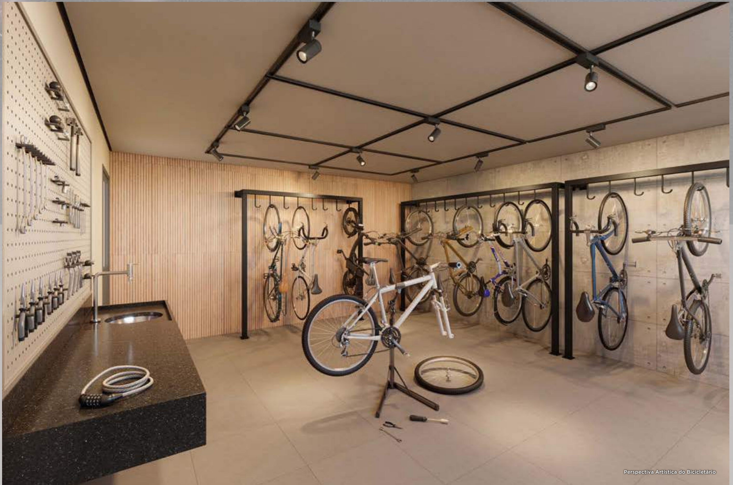
Perspectiva Artística do Bicicletário