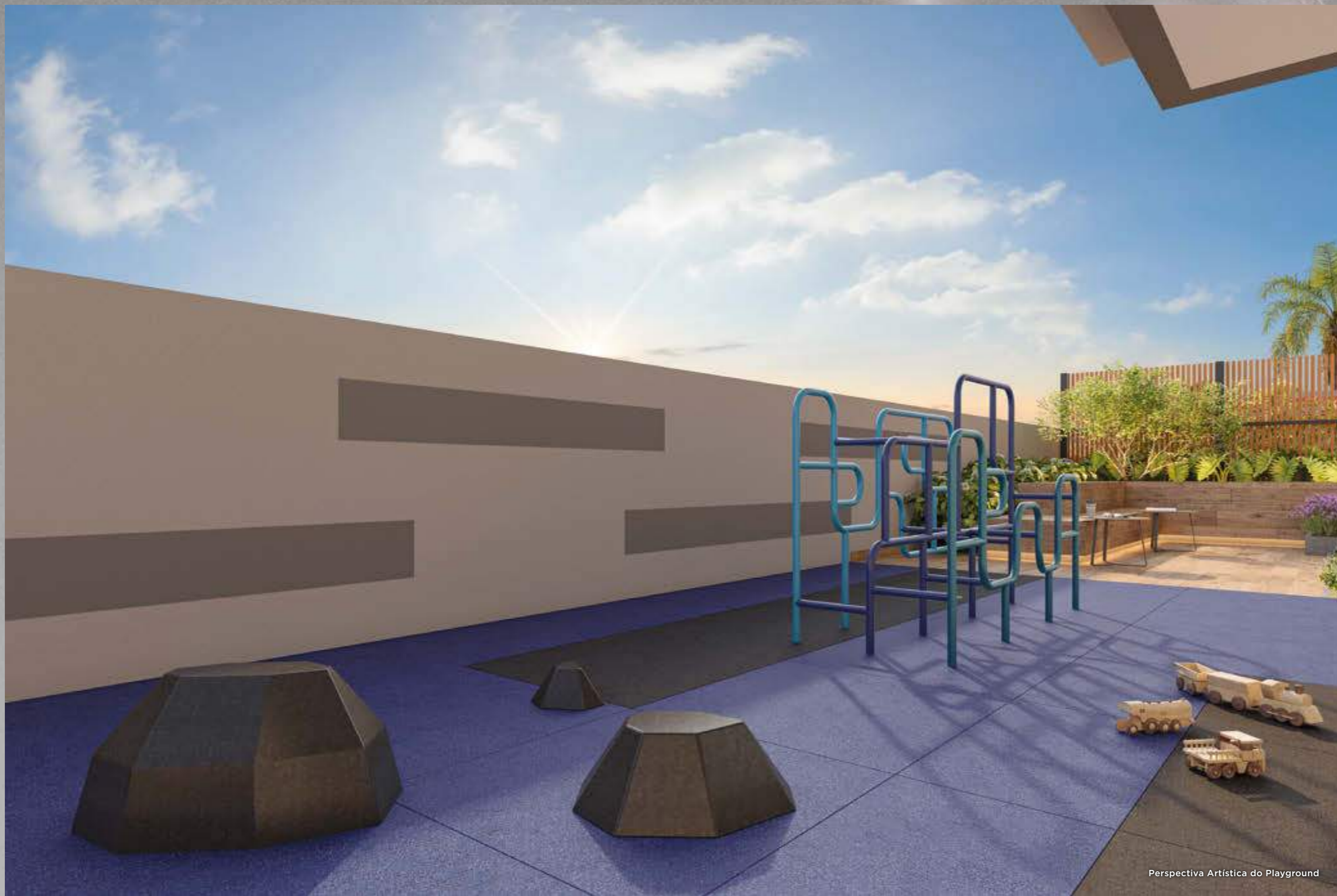
Perspectiva Artística do Playground