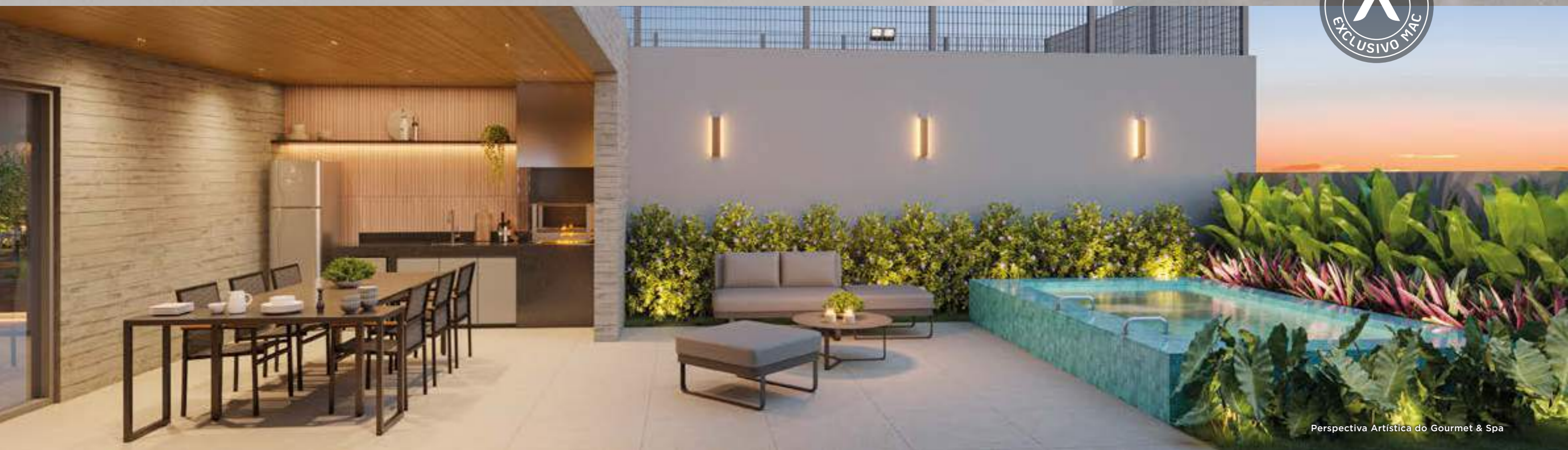
Perspectiva Artística do Gourmet & Spa