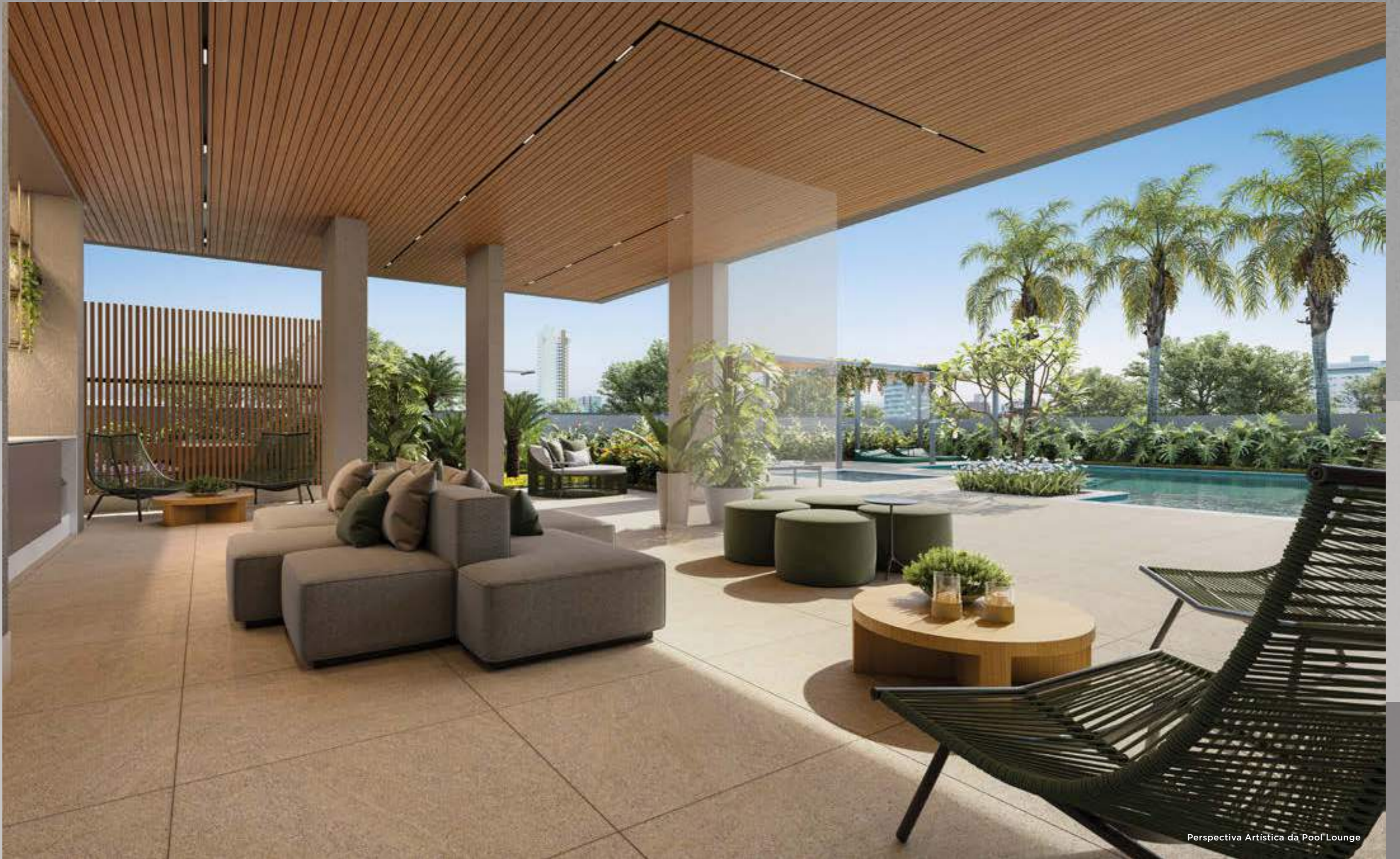
Perspectiva Artística da Pool Lounge