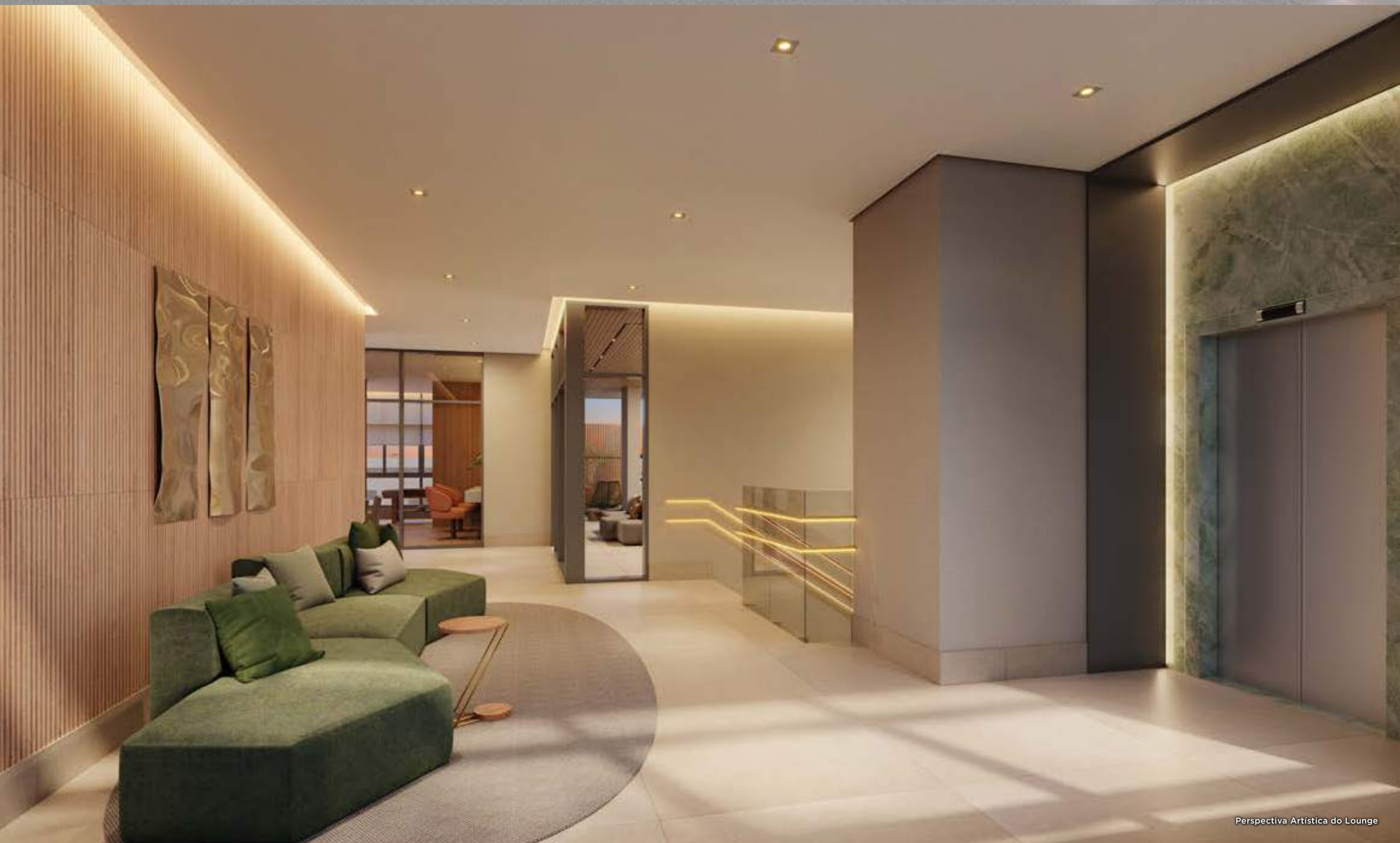
Perspectiva Artística do Lounge