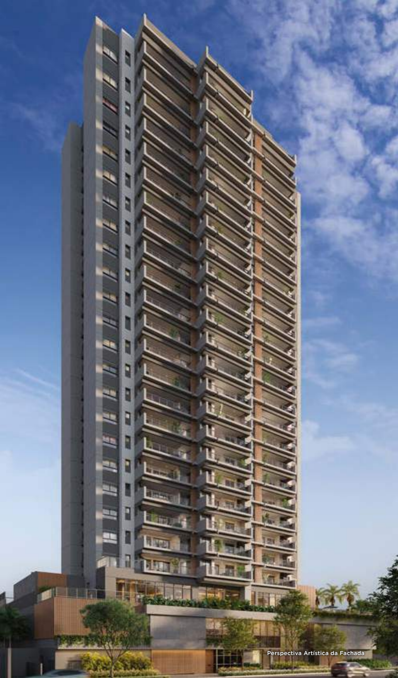
Perspectiva Artística da Fachada