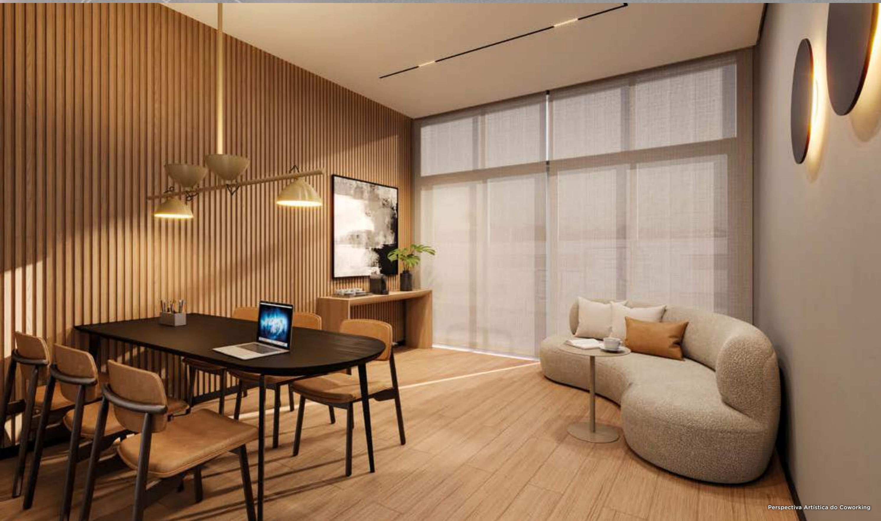
Perspectiva Artística do Coworking