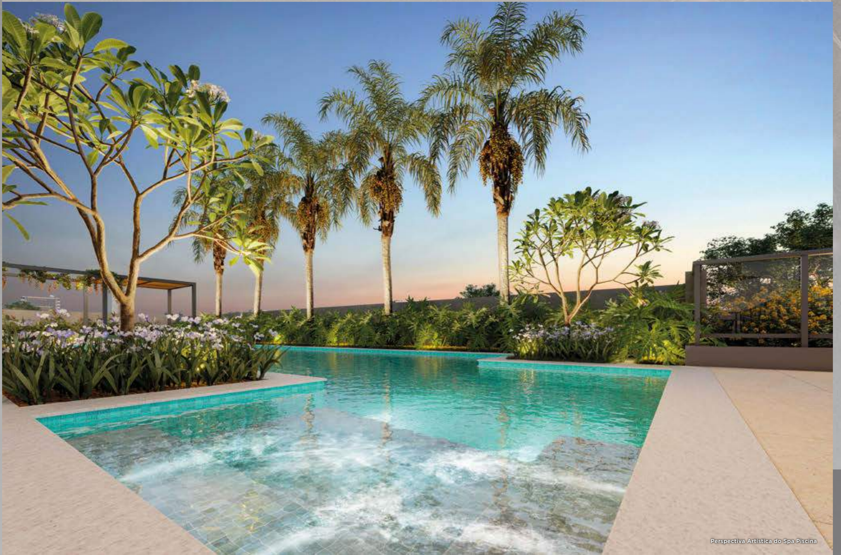
Perspectiva Artística do Spa Piscina