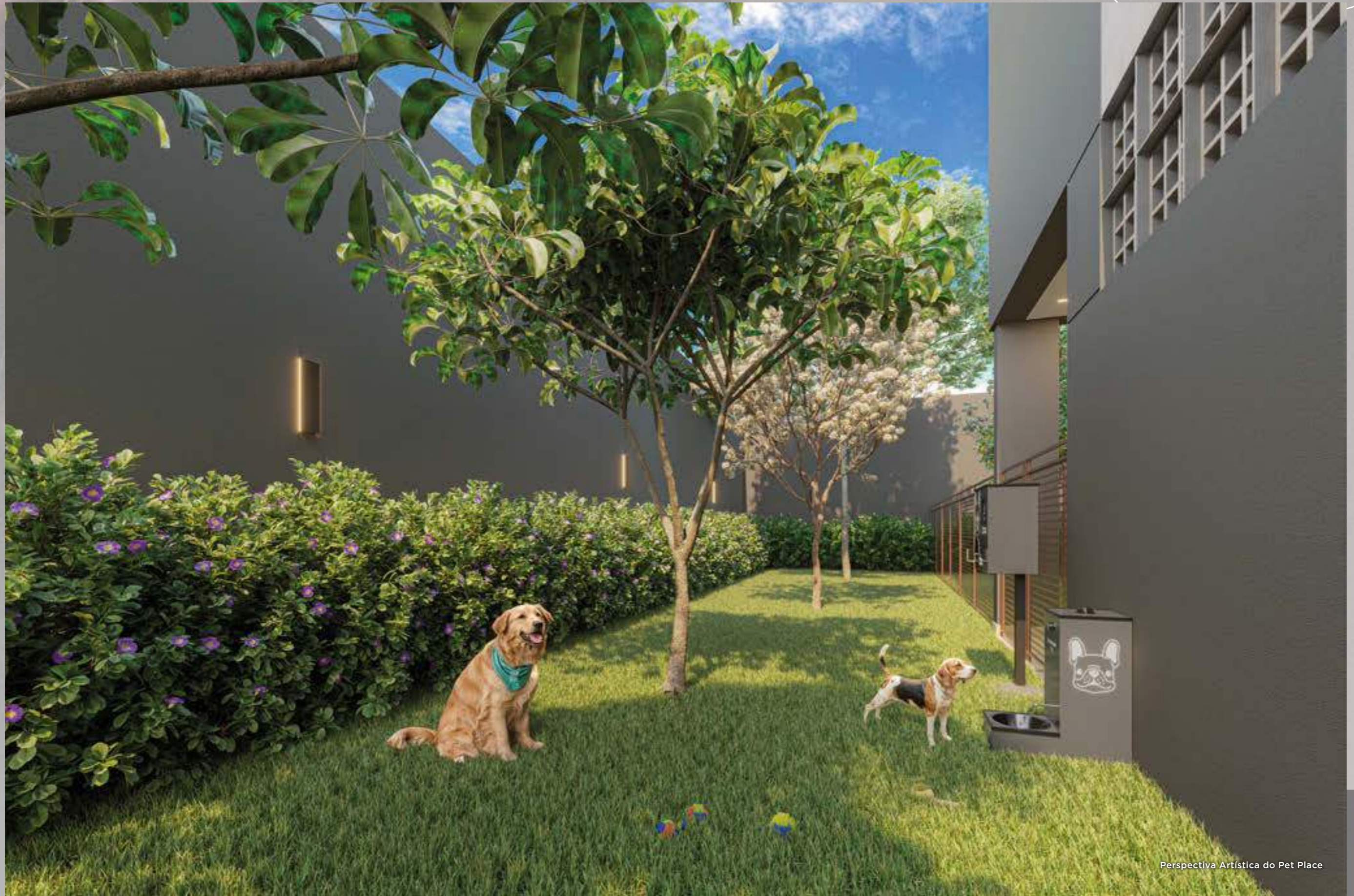
Perspectiva Artística do Pet Place