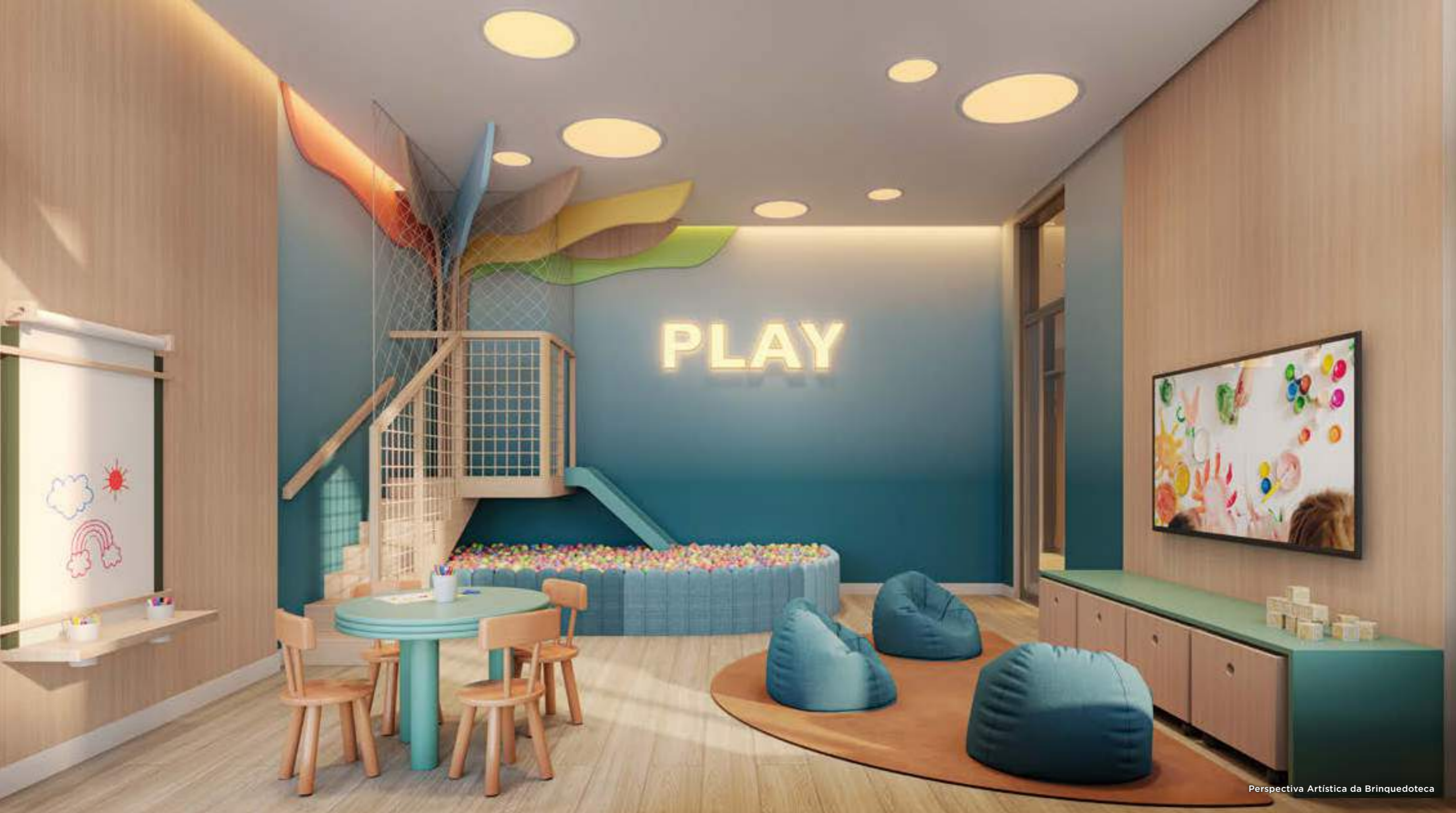
Perspectiva Artística da Brinquedoteca